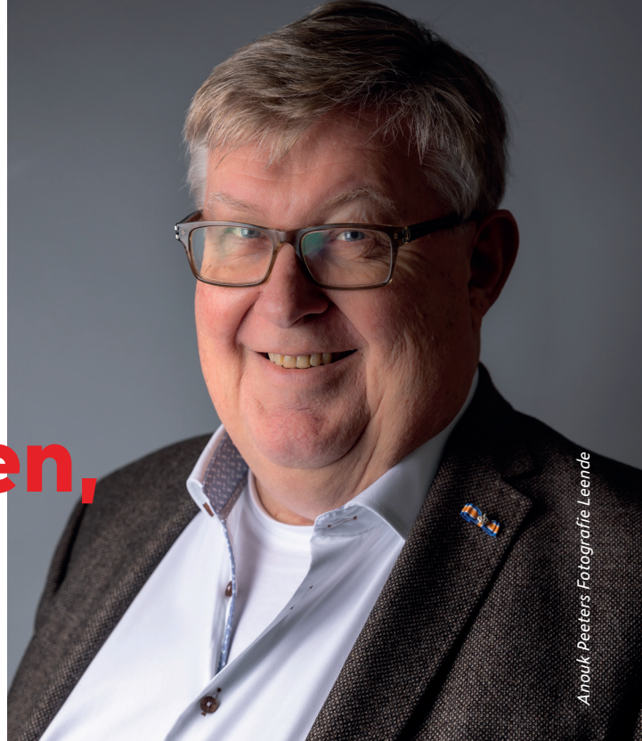
Anouk Peeters Fotografie Leende